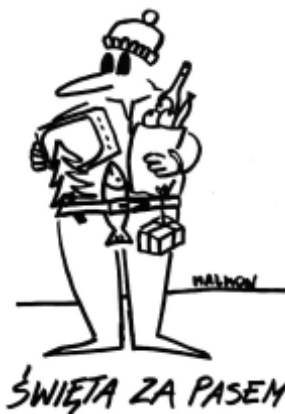
ŚWIĘTA ZA PASEM.