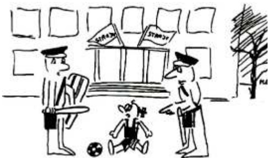
POCZAS STRAJKU ZAPEWNIONO DZIECIOM OPIEKĘ.