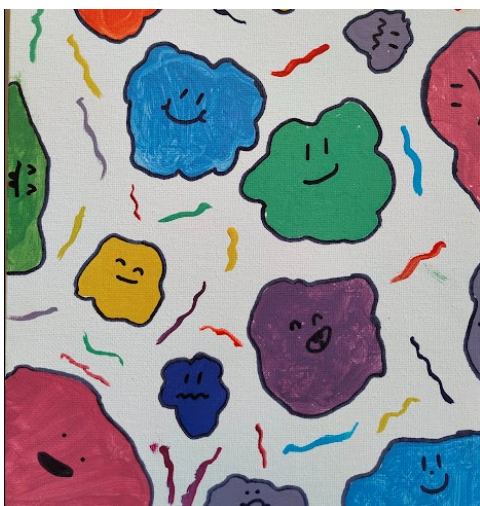
Rys. Natalia Snopczyńska, kl. VII ai