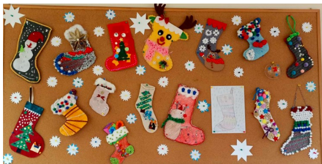
Rys. Prace konkursowe uczniów

Kolejnym pomysłem jest słój na świąteczne pierniczki. Duży słoik należy najpierw dokładnie umyć, następnie przykleić etykietę oraz zawiązać ozdobną wstążkę lub sznurek. Można do niego przyczepić kawałek zielonej gałązki lub przykleić szyszkę. Własnoręcznie ozdobione szklane opakowanie będzie bardzo oryginalne.