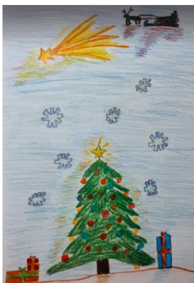
Rys. Patryk Ziemens, kl. VI b